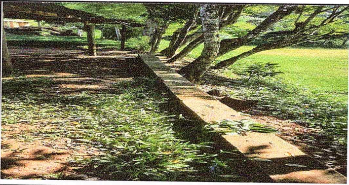
Foto 5: Se observa la falta de block de piedra en esta parte del modulo de la circulacion.