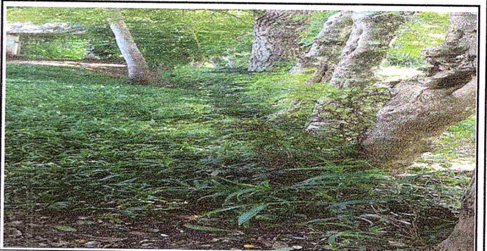
Foto 6: Se observa la falta de construccion en esta parte del modulo de la circulacion.

Observación: Si es necesario se pueden agregar hojas adicionales y actualizar el número de hojas.