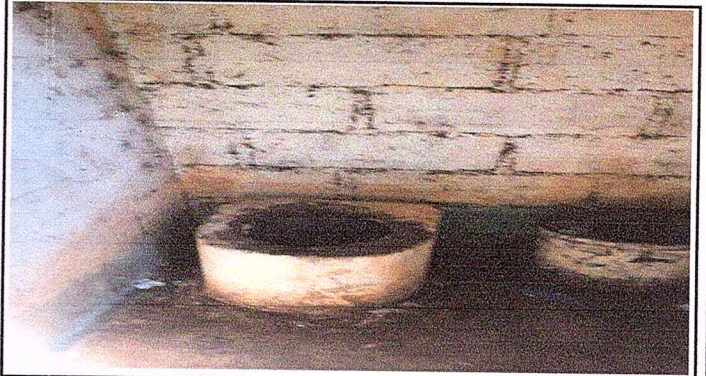
Foto 2: Se observa el deterioro de la taza sanitaria del modulo de la letrina.