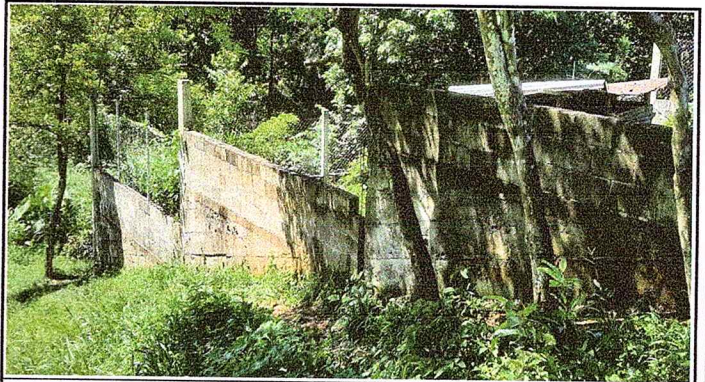
Foto 4: Se observa la falta de mallas en esta parte del modulo de la circulacion de la escuela.